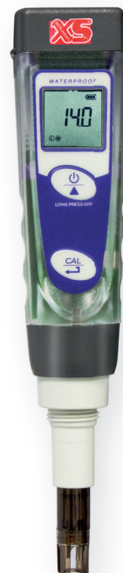
Tester COND 1