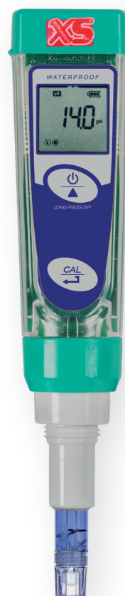
Tester pH 1