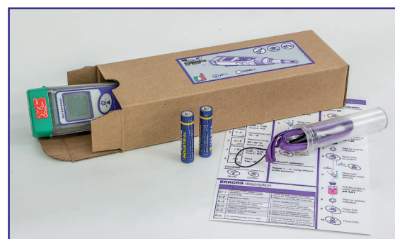
Tester kit in Ecopack